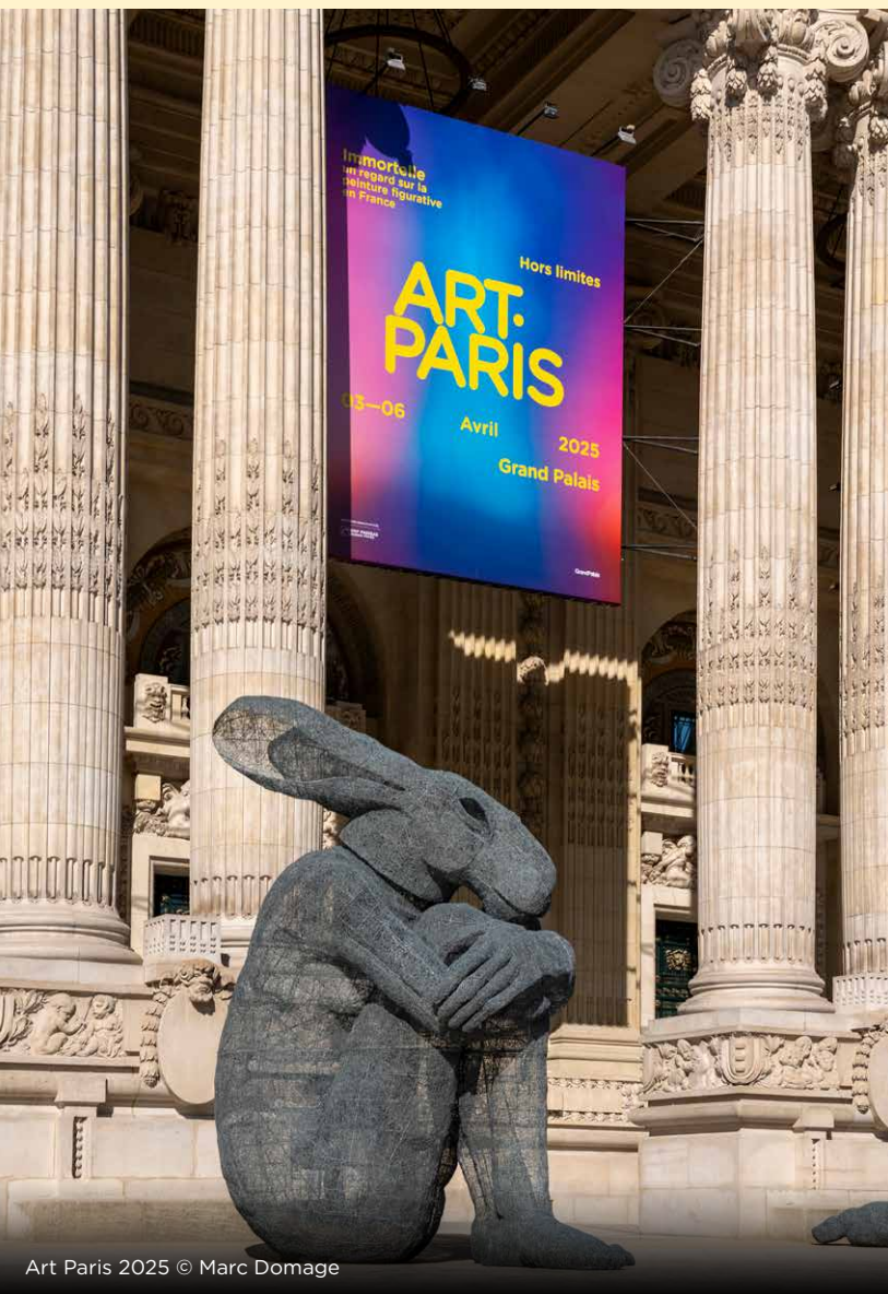
Art Paris 2025